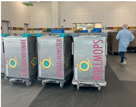
Bei Pauls Kitchen.