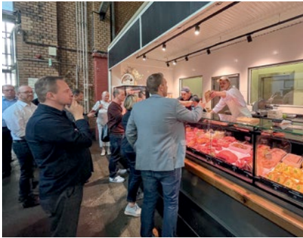
Bei Kumpel und Keule gibt's leckere Burger.