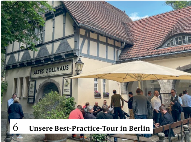
6 Unsere Best-Practice-Tour in Berlin