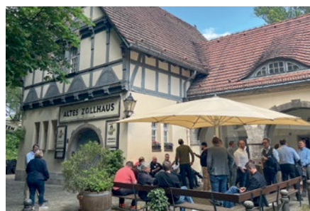
Vor dem Rutz Zollhaus.