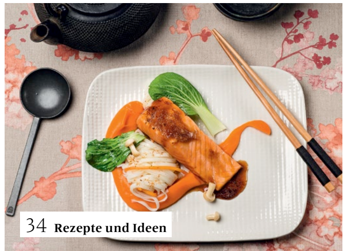
34 Rezepte und Ideen