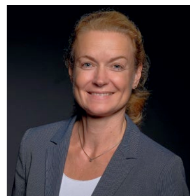
Heike Sievers Redaktionsbüro