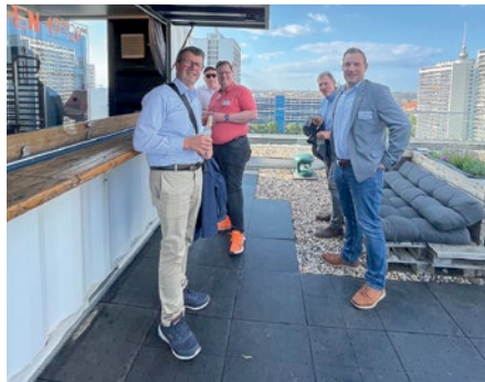
„Sundowner“ über den Dächern Berlins.