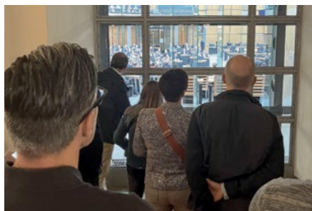
Ein Blick in den Plenarsaal: Die Berliner Regierung tagt.